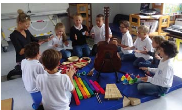
Der Unterricht wird bei den COLE International Schools pädagogisch wertvoll gestaltet.

Globalisierung: Zusammenarbeit mit Universitäten und Privatschulen aus Großbritannien, Spanien, Griechenland, und Slowenien. Anerkannte EU-Praktikums-Ausbildungsstätte für Pre- und Primary Schools