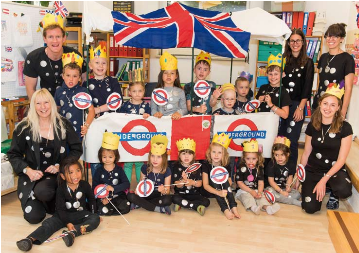
Die COLE International Schools arbeiten eng mit englischen und anderen europäischen Universitäten zusammen. Hier herrscht ein internationaler Flair.